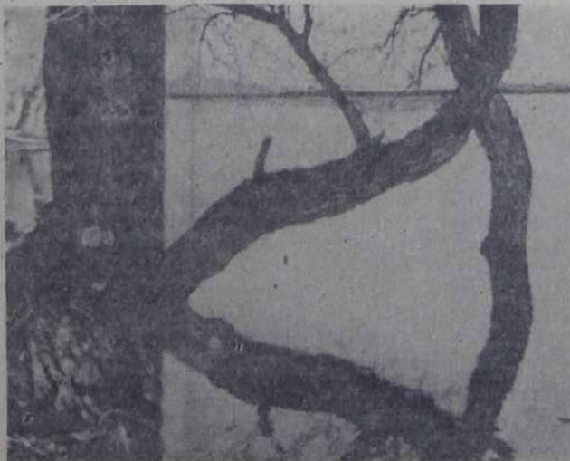
На утренней зорьке, по чистой воде Приятно рыбачить везде...