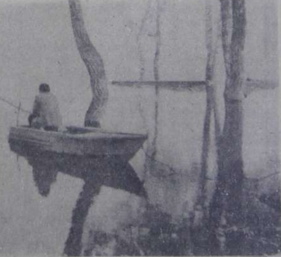
Так пусть же и воздух, и Волги вода Прозрачными будут всегда!

Не допускать строительства новых крупных промышленных объектов без широкого обсуждения общественности и экологической экспертизы.