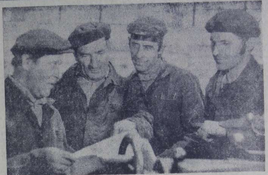
При первом взгляде на эту фотографию в голову приходит сравнение: четыре мушкетера. Чем же «вооружены» эти мушкетеры? Рабочей смекалкой, опытом, умением мыслить творчески.

Выражаем надежду, что каждый трудящийся нашего объединения глубоко осознает эти проблемы. Их невозможно решить, если ими не заниматься в каждом трудовом коллективе. Мы твердо уверены в том, что все трудовые коллективы под руководством партийных организаций мобилизуют все резервы на успешное выполнение намеченной социальной программы.