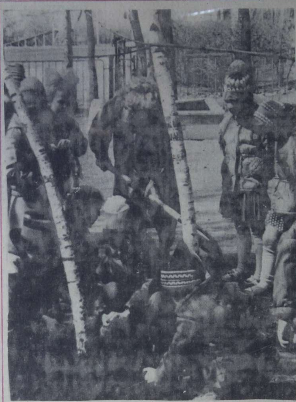
Расти будем вместе.