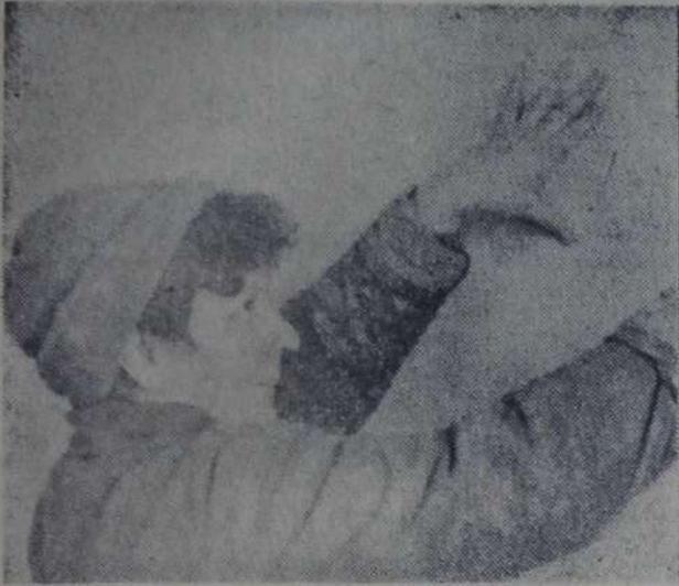
Жилье - 2000