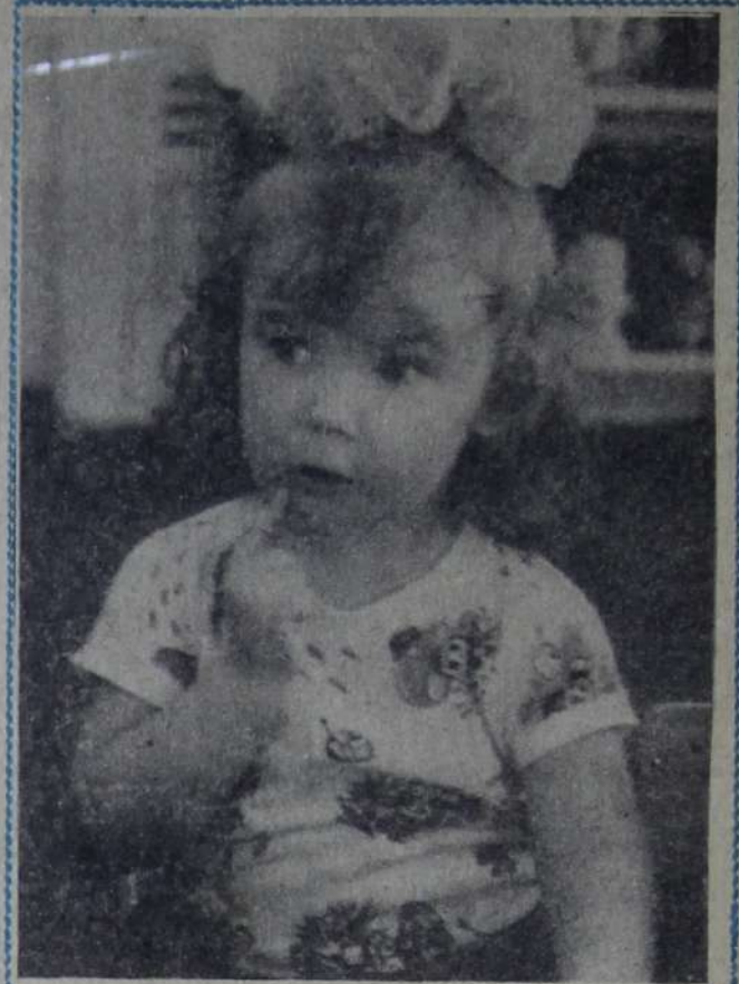
Вопрос, конечно, интересный...