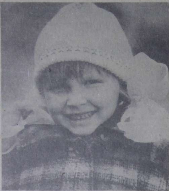
А мне не холодно.