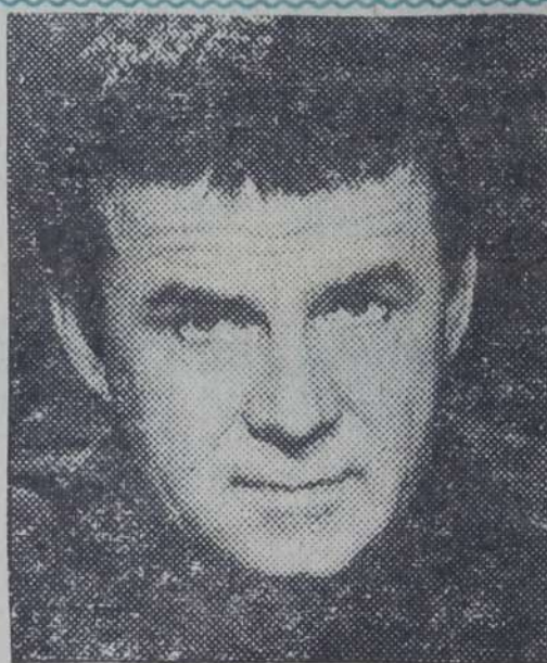
Врач-психотерапевт А. М. Кашпировский.

17.00 Для старшеклассников. «Под знаком Зодиака». 17.40 Мультфильм. 17.50 «Антракт». Интересный собеседник. 18.50 Объявления.