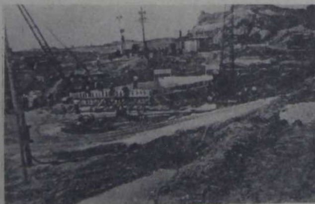
ЗДЕСЬ БУДЕТ ГЭС. 1956-й ГОД.