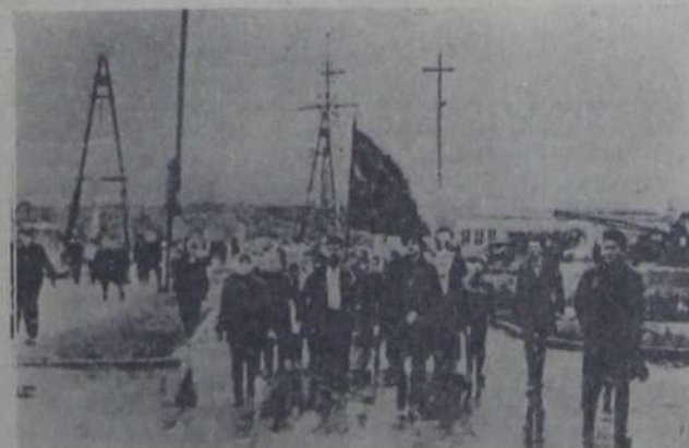
НА КОМСОМОЛЬСКИЙ СУББОТНИК. 1960-й ГОД.