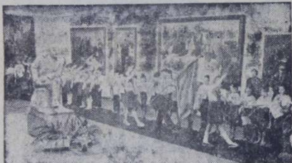
На снимках: посетители музея у исторического броневика; в одном из залов музея проходит торжественный прием в пионеры ленинградских школьников.

Ленинградский филиал Центрального музея В. И. Ленина — одно из притягательных мест города. Сюда приходят и стар и млад. А источник этой притягательности в глубоком интересе к неповторимой личности Владимира Ильича, к его учению, тому пути, которым идет сегодня созданная им партия.