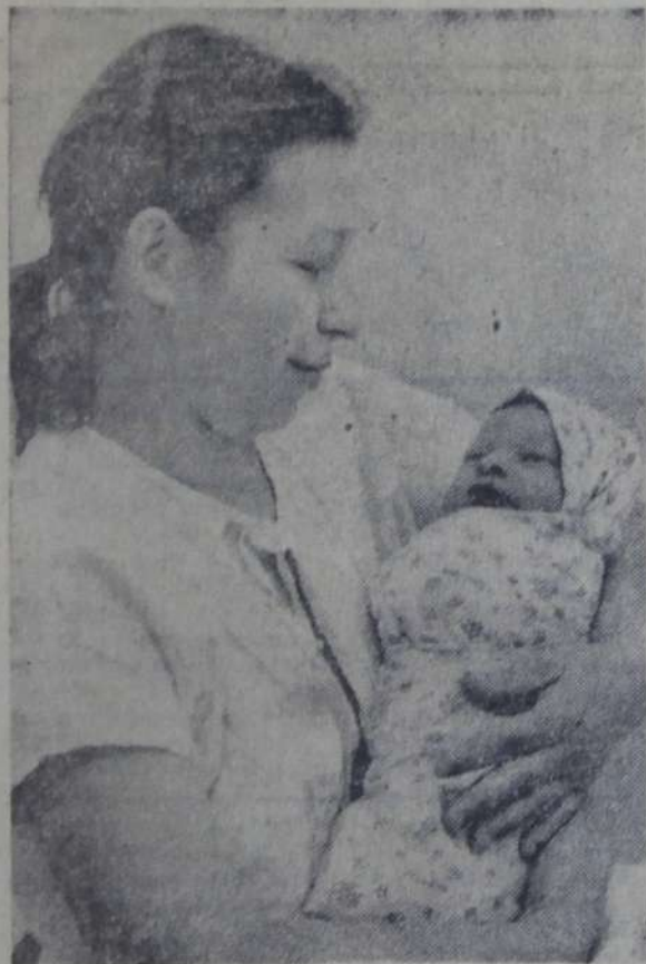
На снимке: виновник торжества на маминых руках.