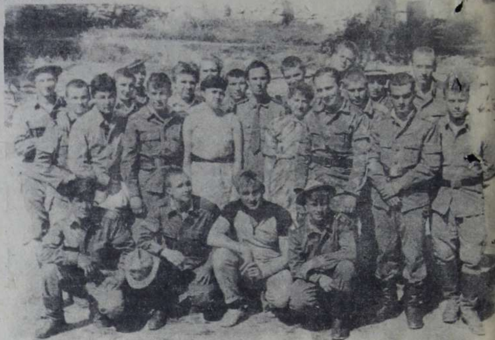
На снимке — вот они, наши подшефные, и др.