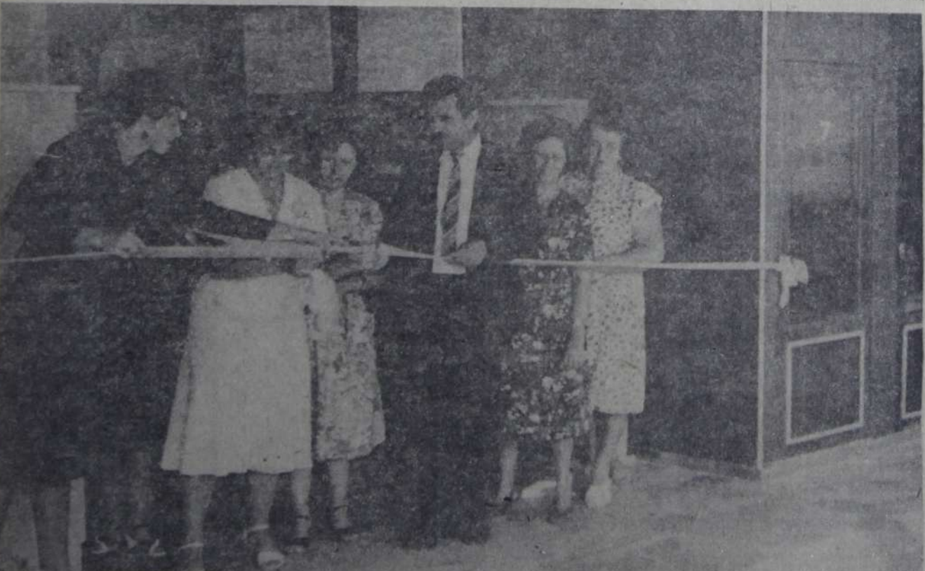
На снимках: Алло, Саратов! Первый клиент. Тор-