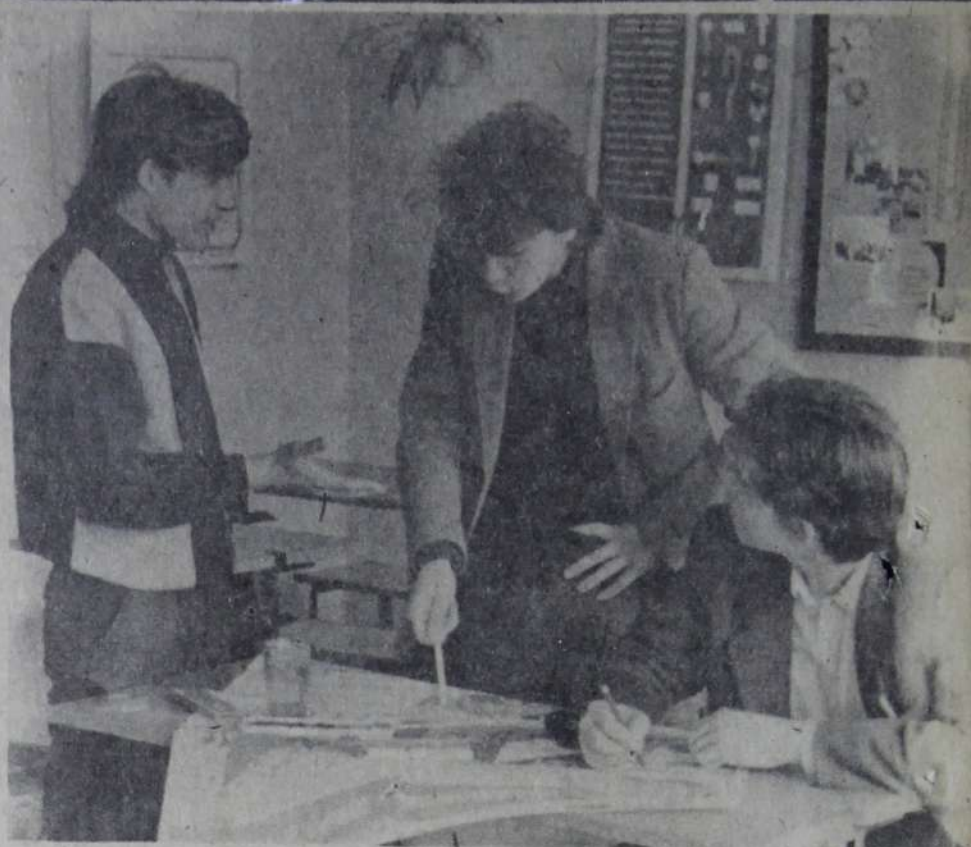
В СПТУ-38 уделяется большое внимание наглядной агитации. Энтузиасты — учащиеся охотно участвуют в выпусках стенных газет, сатирических листовок. На снимке: учащиеся второго курса группы КИП и А за выпуском стенной газеты.