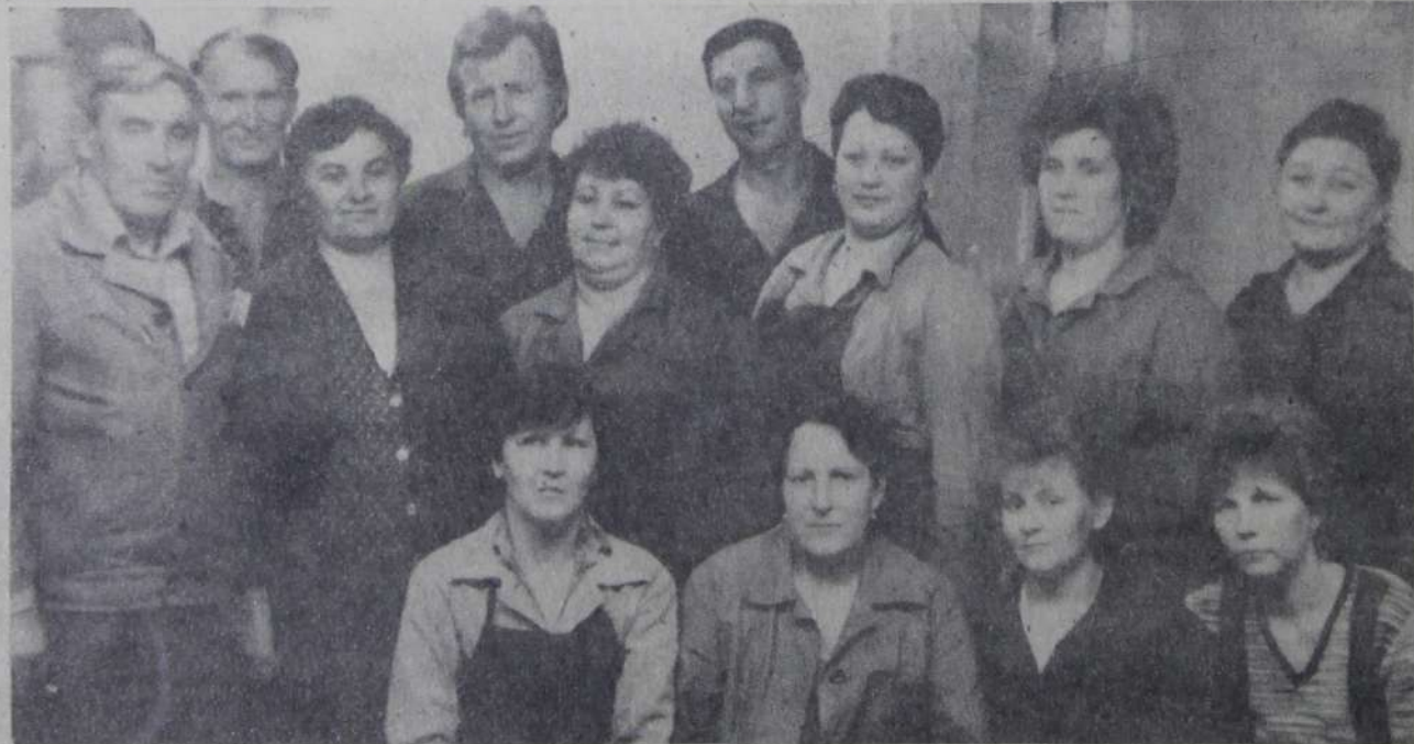
Свыше 30 наименований товаров народного потребления производит завод самоходных землеройных машин. В их числе фурнитура для мебельной промышленности, спортивный и садово-огородный инвентарь. На участие по выпуску этих товаров слаженно трудится

За прошлый год и четыре месяца текущего года городской суд рассмотрел всего 5 материалов по жалобам на