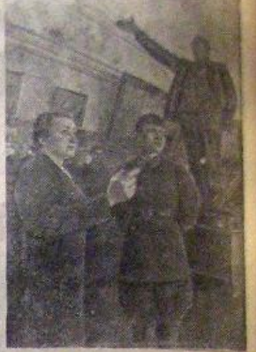
К Ленинским дням. В Центральном музее В. И. Ленина в зале Ленина в 1917—1918 году.

Председатели сельсоветов и колхозов обязаны обеспечить явку председателей касс взаимопомощи. Исполком райсовета, Райсовет.