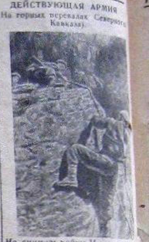
На снимке бойцы И-ского стрелкового отряда, выполняющие боевое задание, выжираются скалы.

в каждом колхозе нужно оборудовать теплячки. До начала ягнения необходимо пересмотреть суягных маток, выделить из отары слабых, истощенных и больных. Необходимо кормить суягных маток хорошим сеном. Не позднее чем за месяц до начала ягнения маткам следует задавать мела и костяную муку. Поить суягных маток необходимо ежедневно после дачи грубого корма. Группы должны быть не более 80—100 голов. При дальних воловопах воду следует подвозить бочками. Содержать маток днем на свежем воздухе, ночью на базу. За 10—20 дней до начала ягнения необходимо очистить кошару от навоза. Пол, стены овчарни и инвентарь продезинфицировать. Полностью заготовить подстилку. Заделать имеющиеся в кошаре щели и отеплить. Сделать решетчатые клетки. Заготовить переносные деревянные щиты и колья для устройства в овчарне оцарок. Обеспечить бригады необходимым инвентарем: вилами, лопатами, ящиком для последов, резиновыми сосками, бутылками, корытцами для выпойки ягнят коровьим молоком. Каждая ОТФ должна иметь ветеринарную аптечку. На шею ягненка и матери следует подвешивать бирки размером 5 квадратных сантиметра для того, чтобы знать от какой матери какие ягнята. Потому что отбившийся от матери ягненок останется без молока и гибнет. Только при тщательной подготовке к окотной кампании мы обеспечим полное сохранение ягнят. Шапошников, зоотехник райзо.