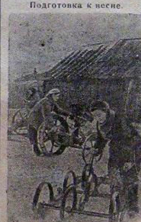
Подготовка к весне. Комсомольцы колхоза „Первое Мая“ (Ивановский район, Ивановская область) ремонтируют сельскохозяйственный инвентарь.

производственных бригад А. Куликова и К. Калинин. Рожнов, секретарь парторганизации.