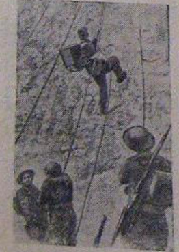
Тренировка канадских войск специального назначения, находящихся в Англии. На снимке: учебные занятия. Связной с полком снарядным забредает на утес.

с 8 февраля с. г. назначаются занятия 3-месячных курсов земледельческого обучения. Председатели колхозов предлагают обеспечить своевременную явку товарищей, выделенных на курсы. Исполком райсовета депутатов трудящихся