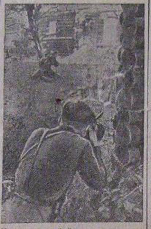
На снимке: бой с карательным отрядом немцев. Партизаны в засаде.

Сила партизанского движения — в неразрывной связи с народом, в повседневной помощи партизанам со стороны населения временно оккупированных немцами районов.