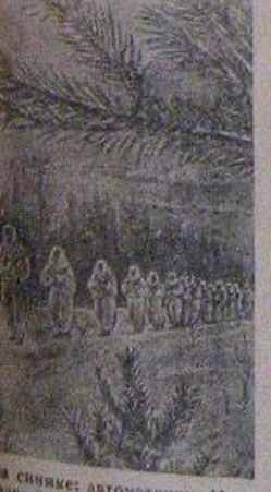
На снимке: автоматчики И-ской гвардейской части выходят на боевую операцию.