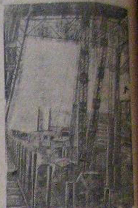
На строительстве Н-ского металлургического завода.