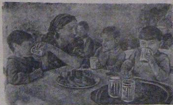
На снимке: в освобожденном от гитлеровцев г. Станице (Калужская область). Дети фронтовиков в своем детском саду за завтраком.

Замечательный пример проявила учительница Федякинской неполной средней школы и общественность Федякинского колхоза имени Кирова, Рязанской области. Они взяли под свой надзор всех детей фронтовиков и создали им возможно лучшие условия для их жизни, учебы, отдыха, роста. Инициатива Федякинского широко подхватилась всей страной.