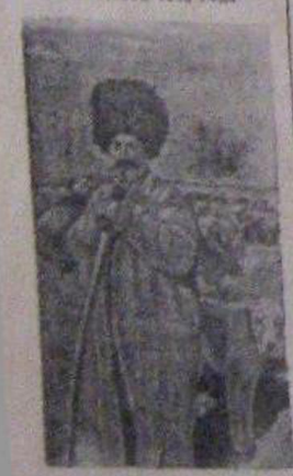
На снимке: рабочий колхоза им. Милана Мила в центре снимка в момент пахоты. До 1 декабря тов. Милан выработал в колхозе 1000 трудодней.

Колхоз „Интернационал“ (Байрам-Алиевский район, Туркменская ССР) выполнил на 127 процентов план развития животноводства. Колхоз получил разрешение с государством по поставкам на 1942 год и исполнил весь план 1943 года по поставке яиц, а также 30 проц. выполнения 1943 года.