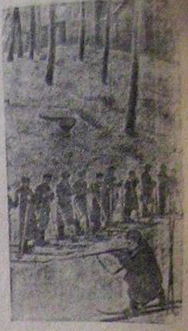
Занятия подразделения лыжников — снайперов всеобща Кушдеевского района (Московская область). На переднем плане — инструктор демонстрирует бойцам стрельбу на лыжах с колевы.

Обозреватель агентства Юнайтед Пресс Кимл высказывает мнение, что Гитлер вынужден использовать свои резервы для отражения наступления советских войск. Это, заявляет Кимл, упрощает задачу вторжения союзников в Западную Европу.