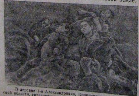
В деревне 1-я Александровка, Колпинского района, Орловской области, гитлеровцы замучили и расстреляли среди многих местных жителей.