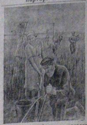
Уборочные работы в колхозе Буденного (Брховецкий район Краснодарского края).