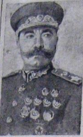
Семен Михайлович Буденный, член ЦК ВКП(б), маршал Советского Союза, родился 25 апреля 1883 г. в семье крестьянина-бедняка на хуторе Козуров, Сальского округа, Донской обл. Рано узнал Буденный всю горечь тяжелой багряной жизни. Грамоте обучался самоучкой. В 1903 г. Буденный был призван в царскую

Мы плохо работали по вовлечению лучших людей в партию, — говорит, выступая, тов. Григорьев. — Надо резко изменить свое отношение к этому большому делу и по-серьезному заняться этим вопросом. База роста у нас есть. Одновременно с этим необходимо сейчас особое внимание уделять борьбе с хищением хлеба на мельницах. Мы много об этом говорим, а делаем мало. Надо от слов перейти к делу.