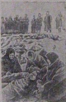
На снимке: место расстрела за кирничным заводом, где фашисты убили больше 200 человек.

вали верхнюю одежду, сняли обувь и полуголую повели по снегу. На глазах у жителей ее приваляли к дерзкому забору. Люди безмолствовали. Когда же один из немцев пошел к краю забор и изник пламени побежал по тулоху несгнвшему дереву, среди жителей раздался вопль и стоны. Девочка подняла голову и тихо сказала: "увидите мать, мать увидите". Огонь подбирался к обрешетке. Вот загорелся пламя. Немцы, торжествуя поскорее закончить казнь, облили тело подростка керосином. Огонь охватил Настю, и она поникла головой. Ни стоны, ни жалоб не раздалось из ее опаленных уст. Когда востер догорае, фашисты согнали дотла дерево и унесли с собой всех жителей.