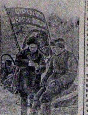
На снимке: отправка красного обоза с зерном для фронта.

600 пудов хлеба и подарок Красной Армии слат колхоз „Спартак“ (Советский район, Красноярский край), выполняющий поставку зерна государству.