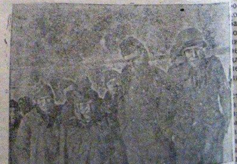
Группа немецких пленников, захваченных советскими бойцами при взятии местечка Н.

Близ Мидделбурга (Голландия) взорван немецкий склад боеприпасов. Убито и ранено 13 немецких солдат из охраны склада. Возле Петровац произошли трехдневный бой югославских партизан с итальянской частью. Итальянцы отступили, потеряв убитыми 114 солдат.