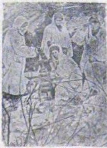
Действующая армия (Западный фронт).

На снимке: Минюетчики подразделение лейтенанта Кирильцева ведут огонь по врагу на дальних подступах к Москве.