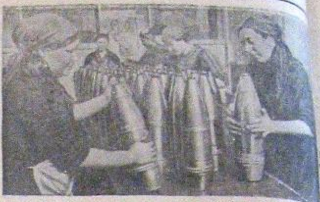
Коллектив Н-ского завода в одном из городов Поволжья во время быстро перестроил свою работу и начал выпускать вооружение для Красной Армии. На снимке: бригада упаковщиц смазывает снаряды.