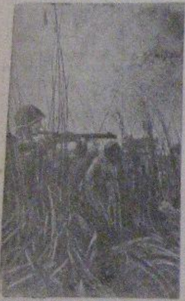
Автоматчики комсомолец И. Д. Поддубный и Я. Д. Иминов пробиваются камышами в разведку.