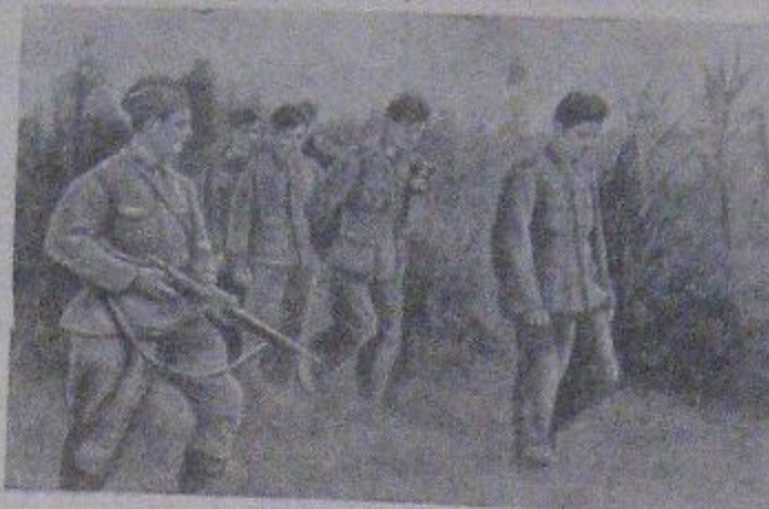
Группа гитлеровцев, захваченных в плен, направляется в тыл.