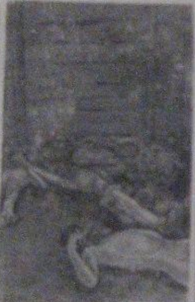
На снимке: сарай, превращенный немцами в кровавый гитлеровский заставок. Здесь наши бойцы обнаружены десятки трунов захваченных гитлеровских выстрелами наших красноармейцев.