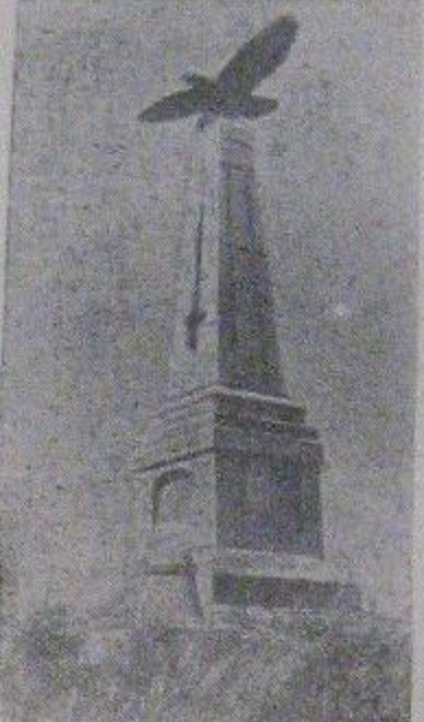
На снимке: Памятник фельд-маршалу М. И. Кутузову в Бородино на месте великой битвы.

К 130-летию Бородинского сражения (7 сентября 1812 г.—7 сентября 1942 г.)