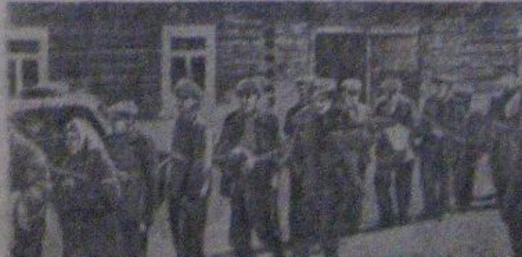
На в чем неповинных мирных советских людей немцы и их пособники убивают и грабят, как скот на бой. (Снимок найден у убитого немецкого солдата).

ты, эвакуированные во время войны в глубь страны. К участию в розыске детей привлечены комсомольские организации, работники отдела народного образования, директора школ, педагогов. (ТАСС). 10 сентября.