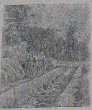
Этот снимок найден у немецкого солдата Курта Зайндера, убитого на Северо-Западном фронте. Фашистское чудовище спокойно щелкало затвором фотоаппарата, наблюдая как наполняется ров телами советских людей. На краю рва очередные жертвы перед расстрелом.

На грабеж и чудовищные зверства фашистов ответим стахановской работой в тылу