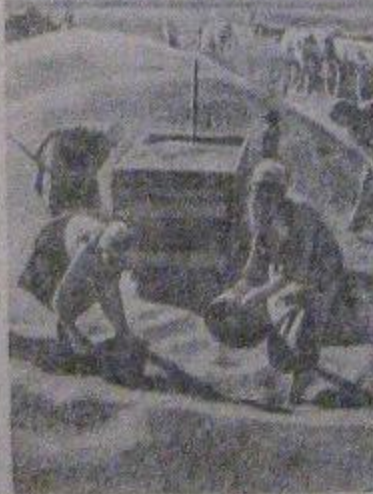
Взвешивание зерна нового урожая на току колхоза „Первая Алексеевка“ (Муставский район, Чкаловская обл.).