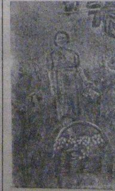
На снимке: уборка винограда на участках совхоза.

В этом году совхоз им. Ильича (Сухумский район, Абхазская АССР) дает стране около 150 тонн винограда разных сортов. В сов- хозе уже началась уборка. Пер- вая тонна собранного винограда была отправлена в госпиталь.