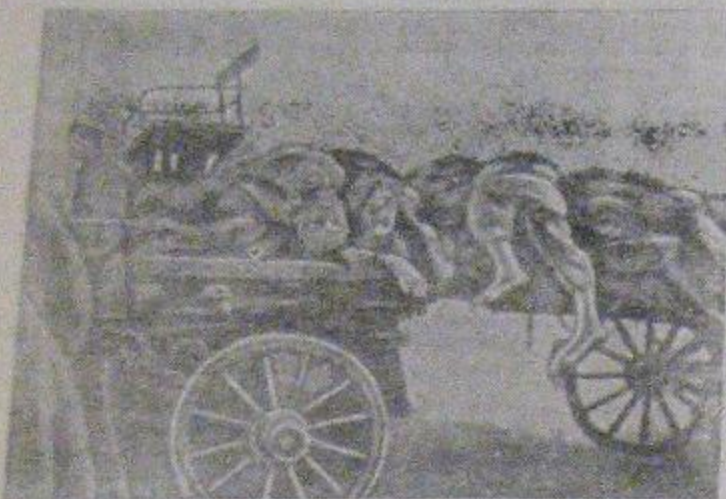
На снимке: Группы воинов красноармейцев, замученных фашистскими убийцами, вывозятся на свалку. (Фотогруппа № 15 Главного Политуправления Красной Армии).

Кровавой дорогой прошли гитлеровцы по опустошенной Европе и злословно оккупированным советским районам. Они безжалостно расстреливают и уничтожают местное население — стариков, женщин и детей, пытаясь ринуть красвоармейцев, вымещая на них злословную злобу.