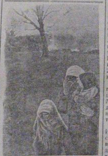
В селе Сербозево, Ленинградской обл., сожженном гитлеровскими захватчиками.

Бурачев, нач. штаба отряда 5 кл. „А“ шк. № 7.