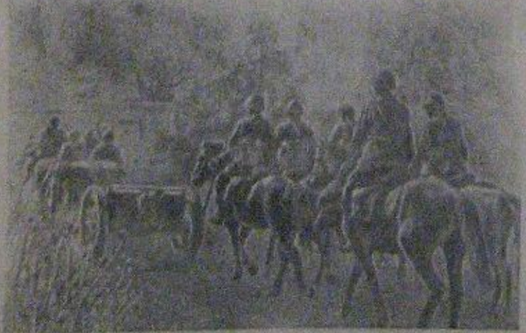
На снимке: конка артиллерии Н-ской кавалерийской части вступает в сражение. Фото А. Грибовского. Фотохроника ТАСС.