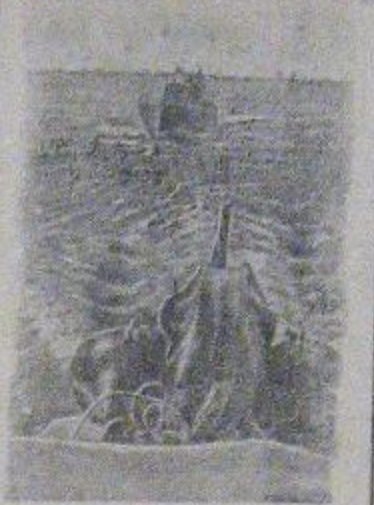
На снимке: катера в боевом походе.

Колхозники, сдавайте зерно государству! Свято выполняйте эту заповедь и досрочно закончите хлебослачу. Этим вы поможете Красной Армии отстоять родину и разгромить врага. Помните! Хлеб это — оружие!