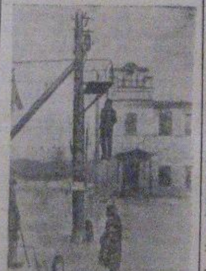
Зверства гитлеровцев над мирным населением в оккупированных советских районах. На снимке: виселица на уаце населенного пункта. (Снимок найден у убитого на Ленинградском фронте немецкого солдата).

В № 101 газеты «Социалистический труд» была опубликована статья: «Новый сорняк — принцип широкостельный». В статье говорилось об открытии этого нового сорняка в колхозе «Трудовик» и предлагались меры борьбы с ним. Исполком райсовета принял развернутое решение, которым обязал правление колхоза «Трудовик» и дирекцию Балаковской МТС провести предлагаемые меры борьбы с принципом широкостельным.