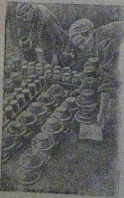
На снимке: сортировка готовой продукции.

На освобожденной земле. Калужская скульптурная фабрика открыла мех по изготовлению глиняной посуды.