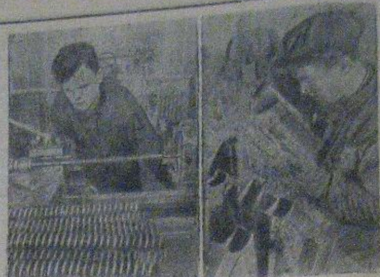
Участники социалистического соревнования стахановцы Н-ского завода, выполняющие по 3 нормы, на изготовлении деталей для самолета...

Требуются Балаковский район: вода; старший бухгалтер и счетовод-кассир.