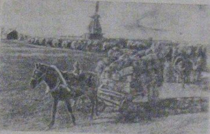
На снимке: Обзор с льготности колхоза „12 лет Октября“ отправляется на льговозов.

В колхозах Горьковской области идет массовая сдача госу- дарству льготности. В передовом колхозе „12 лет Октября“ (Городицкий район) собрали около 300 тонн льготности, при этом 144 тонны