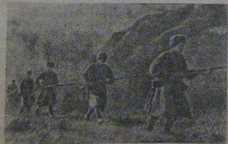
На снимке: стрелковое подразделение, которым командует младший лейтенант Чигридзе, нацеливается на врага.