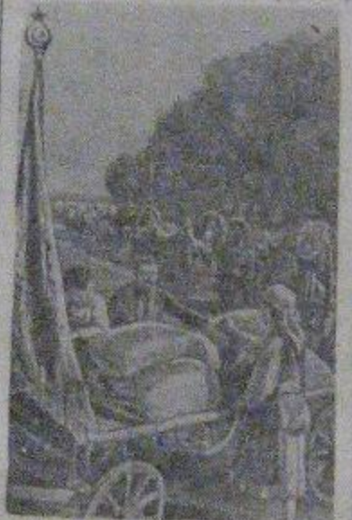
На снимке: обоз с подарками для бойцов РККА отарывается на загородный пункт.

За образцы социалистического труда колхозу вручено районное переходящее Красное Знамя. В ответ на награду колхозники в подарок Красной Армии отправили еще 11 центнеров зерновых.