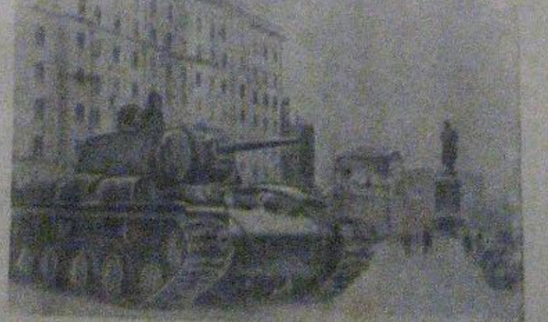
Москва в дни немецко-фашистского наступления. На снимке: Тяжелые танки протодет по площади Пушкина, направляясь на фронт.

Год назад Красная Армия в ожесточенных боях под Москвой разбила немецко-фашистские войска и отбросила их от столицы.