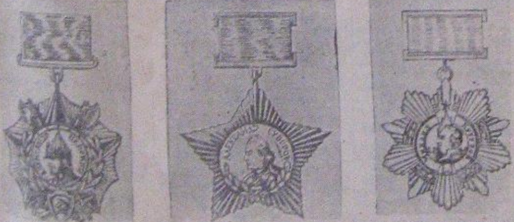
Военные ордена учрежденные Президиумом Верховного Совета СССР для награждения командиров Красной Армии за выдающиеся заслуги в организации и руководстве боевыми операциями и за достигнутые в результате этих операций успехи в боях за Родину. На снимке: (слева направо) Орден Александра Невского, Орден Суворова, Орден Кутузова.

В совхозах, МТС и колхозах работают опытные ремонтники, посланные предприятиями. Городские предприятия выделили на хлебоуборку свыше 100 автомашин, тракторов, бричек. Промартель послала тысячи летней заплат, граблей, ил. (ТАСС)