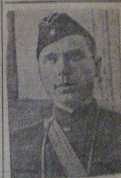
Герой Советского Союза капитан 2-го ранга Н. Лукин, торгпредставитель немецкий линкор „Тирпиц“

зидент США прокламировал торговое соглашение между СССР и США, продленное путем упомянутого обмена нотами между М. М. Литвиновым и г. Корделлом Хэллом. Таким образом, продленное торговое соглашение между СССР и США вступило в силу.