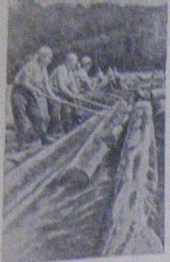
Сотни тысяч кубометров отапливаемой древесины, заготовленной лесопилками Красноярского лесотреста, сплавляются сейчас по таежной реке Мана и ее притокам к основной магистрали — Енисею. В развешенном соцсоревновании за успешный сплав первым идет Усть-Манский славянский участок. Работавшая здесь на выдате леса женская фронтовая бригада выполняет план ежедневно на 350—400 процентов.

Пропал жеребенок в возрасте 1-2 месяцев, жеребенок с белой мастью. Просьба сообщить колхозу им. Калитиной. Правление.