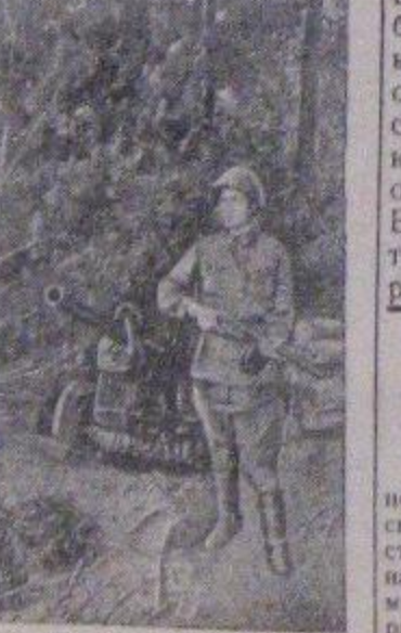
В Н-ской гвардейской краснознаменной стрелковой дивизии. На переднем крае оборонительного рубежа.

самозетов немецкие воздушные объекты летят на воздух, горят, населенные места большие потери и при этом советская авиация не имеет потерь. Германскому командованию приходится выкручиваться и обманывать немецкое население. Раз у русских нет потерь, надо их измучить; если противозащитная оборона немецких городов слаба и ничего не может поделать с нашими самолетами, надо попытаться утопить их в черные реки лесов. И пытаются утопить. Но занятие это бесплодное. Немцам, которые несут потери от наших самолетов, живые заявления «авторитетных» военных кругов Берлина: «Вот, как мы, советские, уничтожили самолеты, а советские самолеты, прилетающие в немецкие районы, уничтожены советской авиацией на ведущих объектах немецких городов». Во-вторых, проделавшая бесценную работу противозащитной обороны советская авиация не имеет потерь. И результаты работы советской