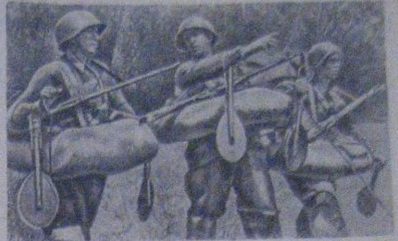
Снаеры Н-ской гвардейской части отправляются на инженерную разведку реки.