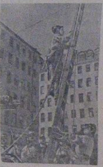
Женщины-пожарники одной из участковых пожарных команд Ленинского района (Ленинград) на тренировке.