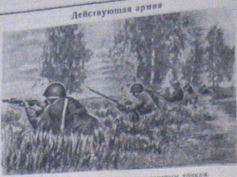
Бойцы ведут огонь по вражеским огненным точкам.