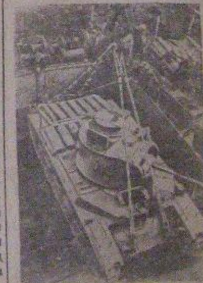
Погрузка танков в одном из портов Англии для отправки в СССР.