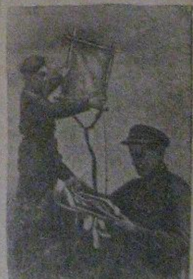
Красноармеец Гольдберг (Сарма) и подруга Семенов готовят змей с дробинками для заброски их в расположение немецких войск.