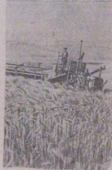
Уборка зерновых в колхозе «Кызыл-Ай» (Базар-Курганский район, Джалаля-Абадская область).