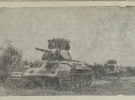
Действующая Армия. Тапки выходят из вышиванки Советского знамени.