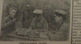
Действующая армия. Дворец немецкого солдата в штабе.