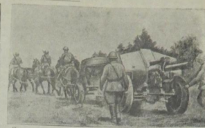
Советские артиллеристы продвигаются на передовые позиции.