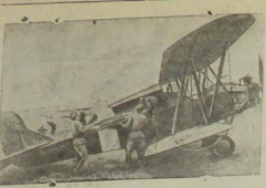
Действующая армия Отправка раненых на санитарном самолете в госпиталь.