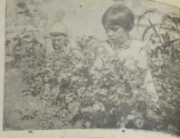
В Баллаковском Доме пионеров в этом году на школьной выставке выставлено статистическое ханное, конспект выставки и на СНИМКЕ пионеры на опытных выставках.