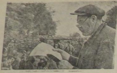
Героическая оборона Одессы Трудились Одессы готовы отразить любой удар врага.

Население города возмодт баррикады. В минуты отчаянья рабочих Е. И. Шамов чаркает свежую газету.