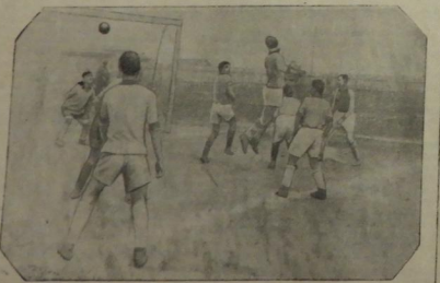
В колхозе имени Балаковых рабочих работают ученики средней школы № 1 г. Балакова. В свободное от работы время они организуют спортивные игры. НА СНИМКЕ: учащиеся и колхозная молодежь работают в колхозе.