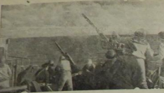
Бойцы охраняют подступы к Ленинграду.