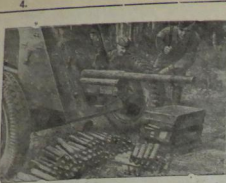
Действующая Армия. Фото И. Шершова, захваченная нашими частями. Фотография ТАСС.

желание приобрести продукты, выполняйте заказы в контору райбюро. 188—1—1.