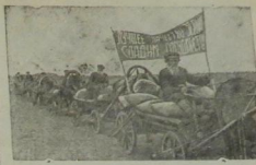
Красный обоз колхоза «Мобедель» (Портландский район, Горьковской области) несет хлеб нового урожая на приемный пункт «Заготзерно».