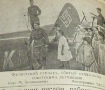
Финский самолет, сбитый отставником советскими летчиками.