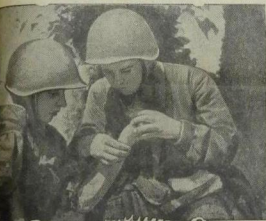
Оказание первой помощи раненому бойцу.