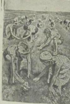
Пioneры Кировского районского г. Москвы, находившиеся в лагере, помогают колхозу Красный Луч. Пушкинского района, Московской области, в прополке огородных культур.