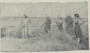
Учащицы Балаковской средней школы на уборке хлеба в колхозе «Ваккоммуна».