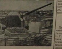
Зенитное орудие в районе Лондонского порта.

на серых курачех и сибирских оленях. 11 ноября 1941 года в окрестностях Бологуй, болотистых и лесных участках охоты охотники охотились на оленей и кабанов. В этот день охотники охотились на оленей и кабанов. В этот день охотники охотились на оленей и кабанов.