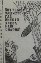
Наклад работ художника М. Китарова, ТАСС.