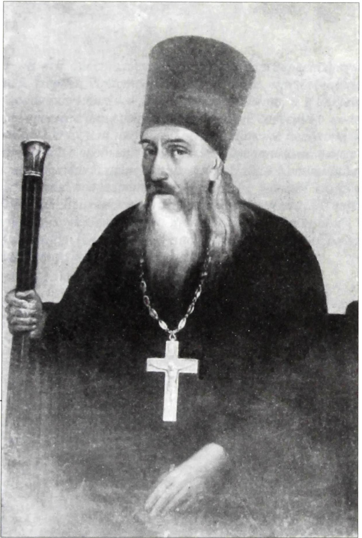
Протоиерей о. Александр Юнгеров (1821–1900 гг.).