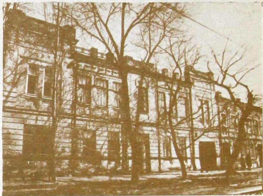
Дом № 56 по улице Кутякова, где жила семья Фединых.

В доме № 56 на улице Кутякова (бывшей Цыганской) Константин Александрович не жил. Дом был выстроен уже после его отъезда из Саратова. Однако он оставался для Федина «самым дорогим домом в Саратове... где умерли отец, мать, сестра и где я чувствовал себя последний раз «дома» в 31-м году, когда — увы! — хоронил сестру».