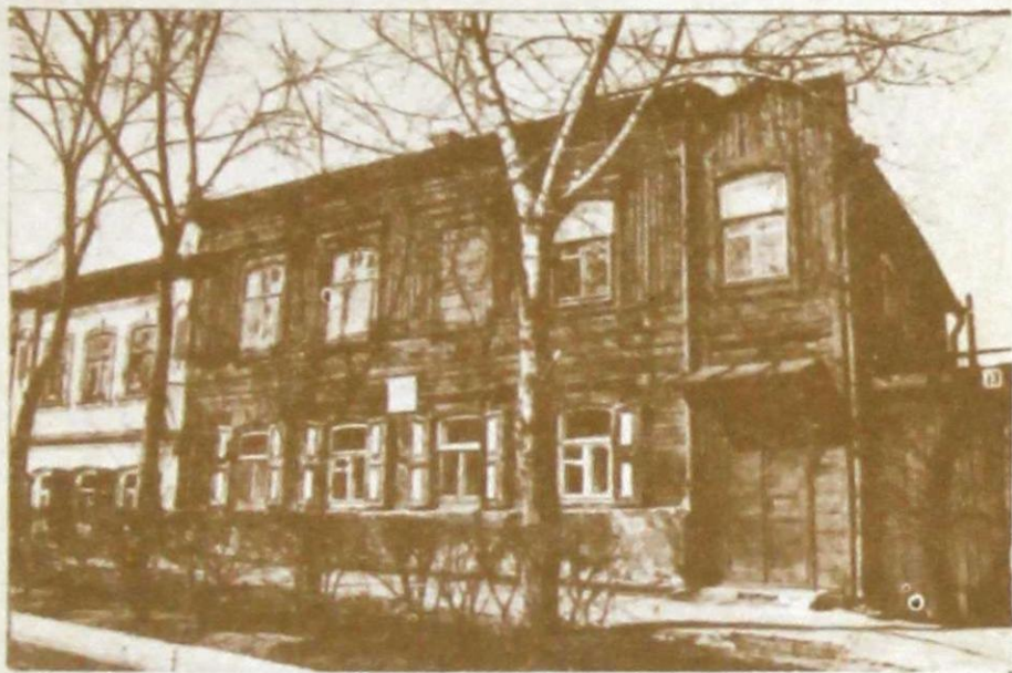
Дом № 13 в Смурском переулке, в котором семья Фединых жила в 1905—1908 годах.

графии двух из сохранившихся домов также представлены в экспозиции зала. Это дом № 13 в Смурском переулке, где Федины жили в 1905—1908 годах, и дом № 56 по улице Кутякова. Из окон дома в Смурском переулке тринадцатилетний Костя наблюдал события первой русской революции 1905 года, черносотенные столыпинские погромы, впечатления от которых отразились в романе «Братья». В автобиографии он писал: «Достопамятные мои отроческие драмы: два побега, брошенное ученье, магазин «и все такое прочее». Но и путешествия по Волге, первые увлечения. И первые «книги жизни» (Лермонтов)».