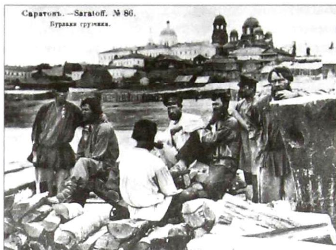
На волжском берегу

лавки посредине, нары по стенам – здесь днем обедали, а ночью отдыхали, сотрясая стены дома богатырским храпом. Грязь, теснота, неудобства. При артели работал кашевар, готовивший трижды в день нехитрое варево – кулеш либо борщ с мясом (по полфунта на человека), либо свежего улова уху, кашу пшеничную либо гороховую, квас, молоко, чай. Резал огромными ломтями хлеб, ставил на стол соль, лук, чеснок. В конце лета в ходу были помидоры, огурцы, арбузы, дыни.