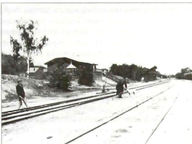
Станция Нефтяная на Увеке

Солдатская слобода была окраинным городским поселком, за ним на несколько километров вниз по Волге никаких обжитых мест не встречалось до самого Увека. Одно из первых упоминаний об Увеке сделано в 1253 году известным путешественником Вильгельмом Рубруком. Тог-