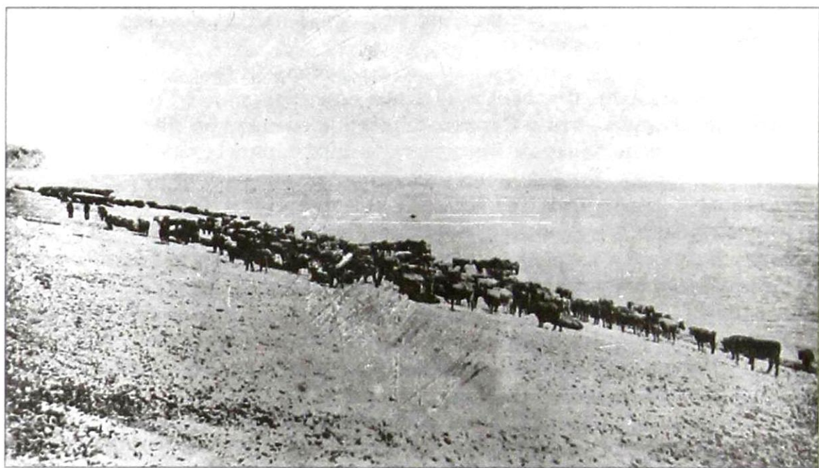
«Пасение скота» на угодьях близ Саратова

представители мещанского населения, хотя встречались владельцы коров, коз и свиней и среди дворян, духовенства и купечества. Но последние составляли в общей массе явное меньшинство, потому столь ответственное и жизненно необходимое для простых обывателей дело целиком было подконтрольно мещанской управе.