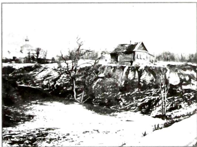
Район Улешей. Церковь Красного Креста. Отрог Кладбищенского оврага

На рубеже XIX–XX веков Улеши были рабочим пригородом, в котором находилось много промышленных, торговых и коммерческих предприятий. Отравляли здесь местный воздух городские боины, где бойцы продавали приходившим бабам ливер и требуху, упот-