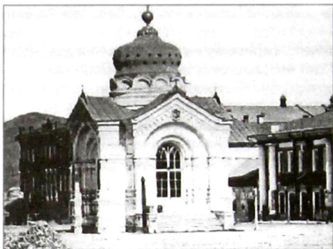
Александр-Невская часовня на Театральной площади, построенная на средства Саратовского цехового общества в 1875 г.

освящено, и управа выделила деньги на подготовку проекта часовни. Его выполнил местный архитектор А.М. Салько, автор многих жилых и казенных зданий в Саратове, в том числе и ныне сохранившихся. Известно, что, разрабатывая проект часовни, Алексей Маркович предполагал украсить ее снаружи аллегорическими изображениями деяний Александра II, но у ремесленной управы оказалось недостаточно средств, и проект получился упрощенный. Но даже и в этом виде миниатюрное здание часовни отличалось привлекательностью форм, добротностью и хорошей функциональностью. Строительство часовни было закончено в 1869 году, но отделка ее продолжалась до 1875 года, ибо средств у ремесленной управы постоянно не хватало. 16 сентября 1875 года часовня была открыта для верующих. Поскольку приписана она была к Александро-Невскому собору, в народе ее называли Александро-Невской.