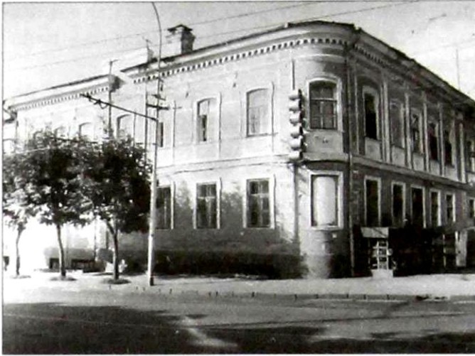
Дом Образцова на углу ул. Московской и Вознесенской. Здесь находилась мещанская управа с 1903 г. по 1918 г.

лагается на Вашу ответственность смотреть за прогоняемыми через выгонными гуртами, чтобы таковые следовали установленной для того одной только дорогой. В противном же случае, если кто прогонять свои гурты будет самовольно через городской выгон без всякого ему на то дозволения, то таковых останавливать и представлять в тот же час в Городскую думу для поступления с ними по закону... Предваряем Вас при этом, что за всякое по