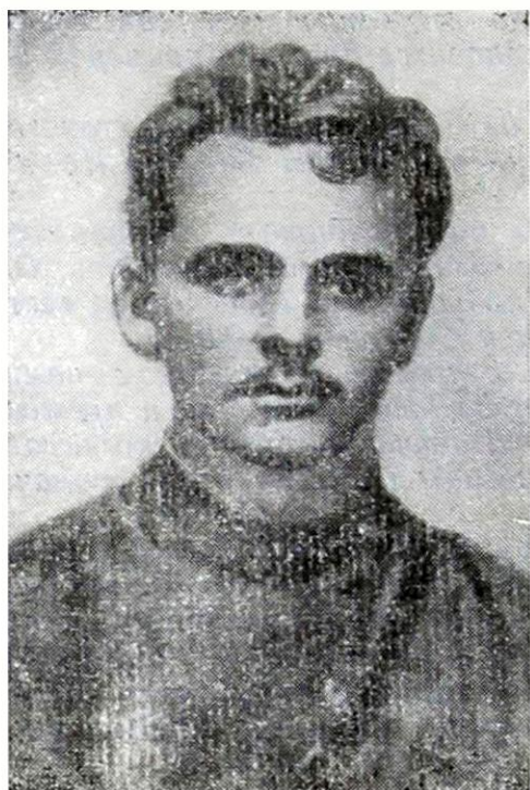
Дмитрий Фурманов. Комиссар Чапаевской дивизии. 1919 год.

сях с тревожными раздумьями автора о предстоящей судьбе рукописи.