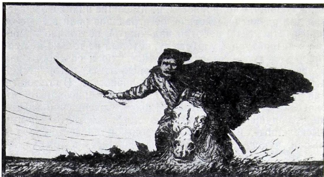
Чапаев-герой. Художник А. Никонов.

В половине 1916 года приехал в Иваново-Вознесенск и вместе с близким другом по студенчеству Михаилом Черновым работал преподавателем на рабочих курсах.