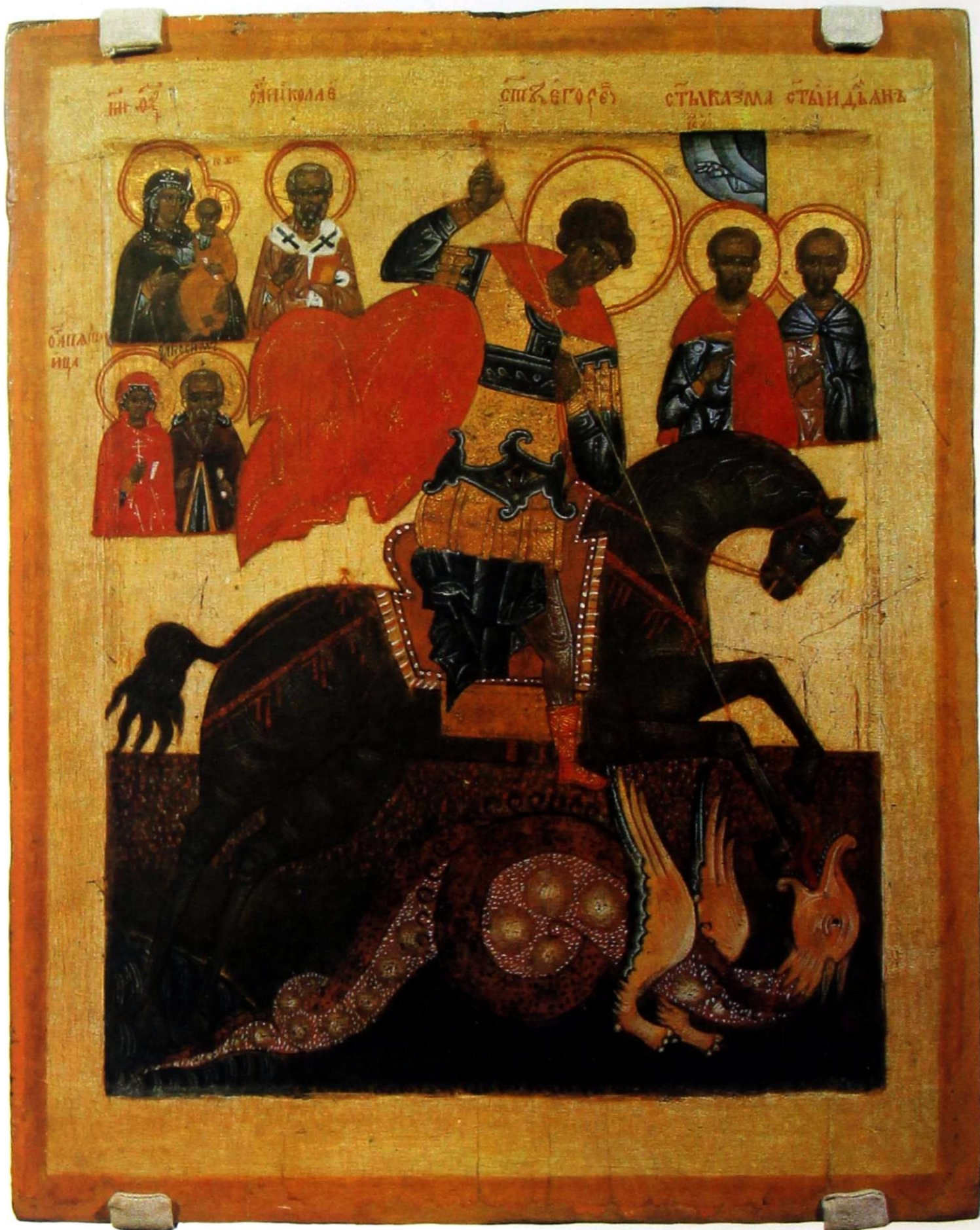
Чудо Георгия о змие и избранные святые. Конец XV – начало XVI века