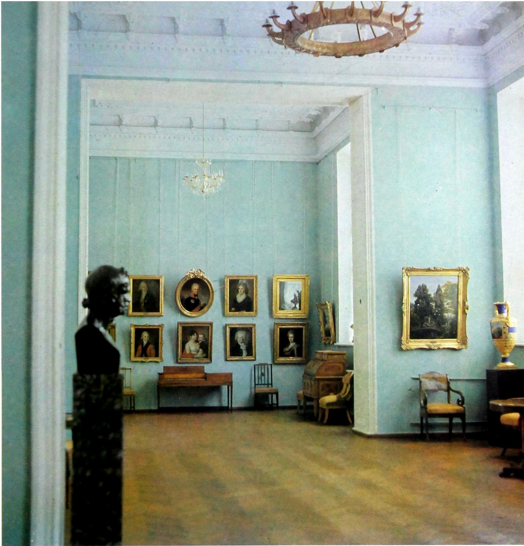
Залы русского искусства XVIII – первой половины XIX века