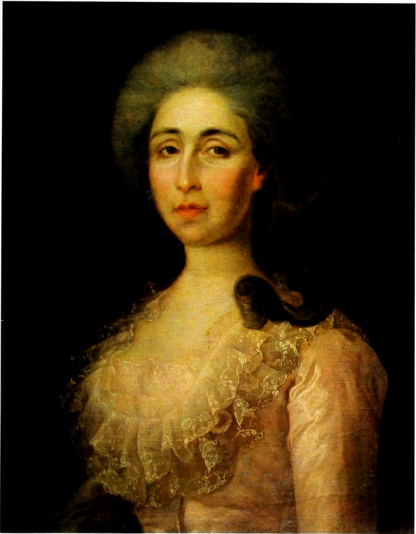
Неизвестный художник второй половины XVIII века. Портрет А. В. Радищевой. До 1783 года