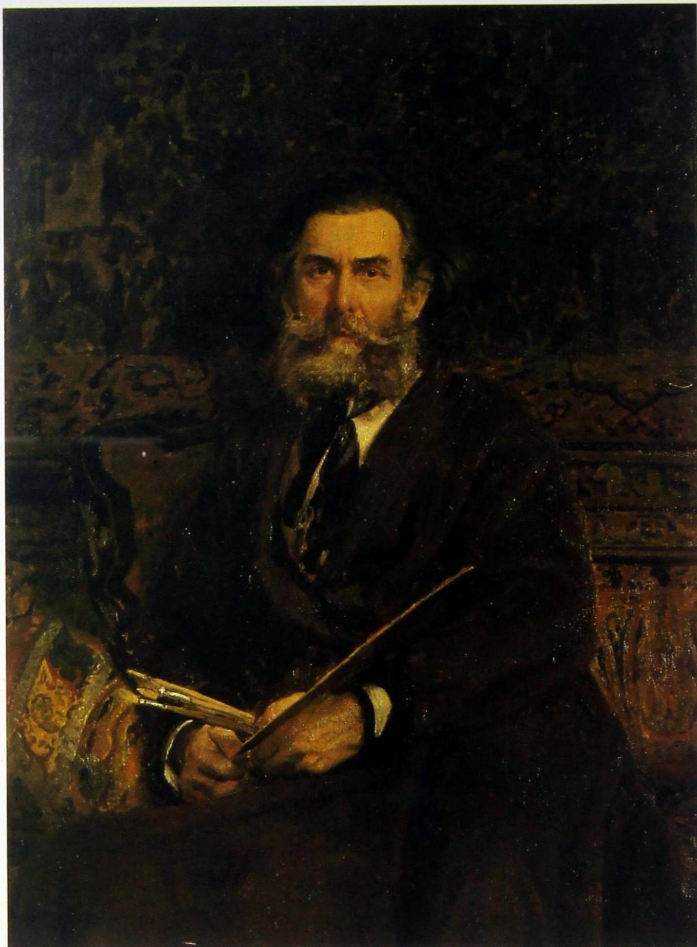
И. Е. Репин. Портрет А. П. Боголюбова. 1876