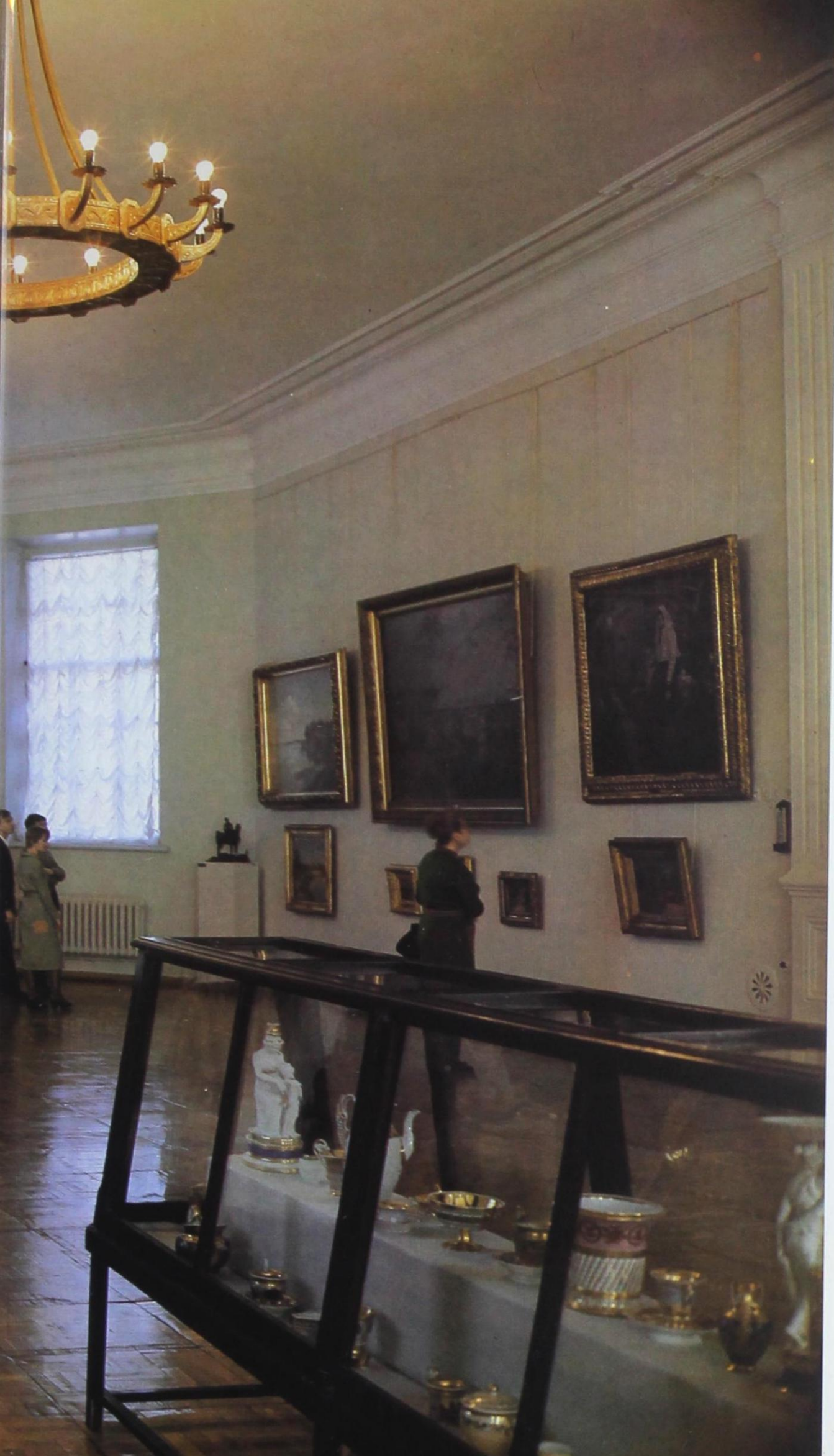
Зал русского искусства второй половины XIX века