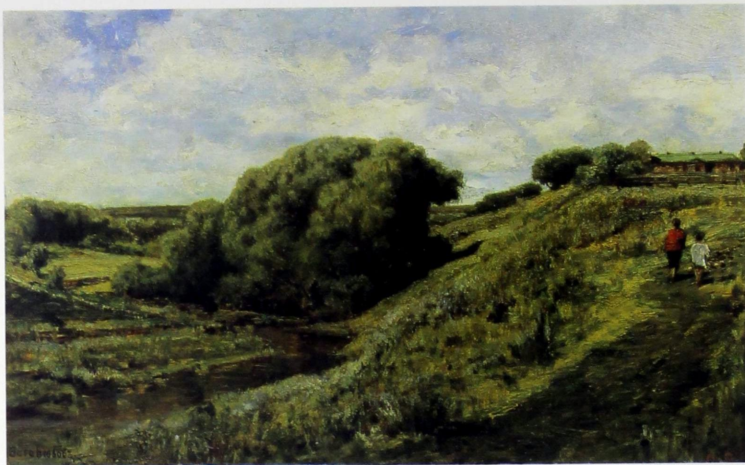
А. П. Боголюбов. Аблязово. Радищевская усадьба. Овраг. 1887

дищевский музей, чтобы именно Саратову принадлежала честь первым в России свободно произнести имя Радищева – выдающегося мыслителя и революционера.