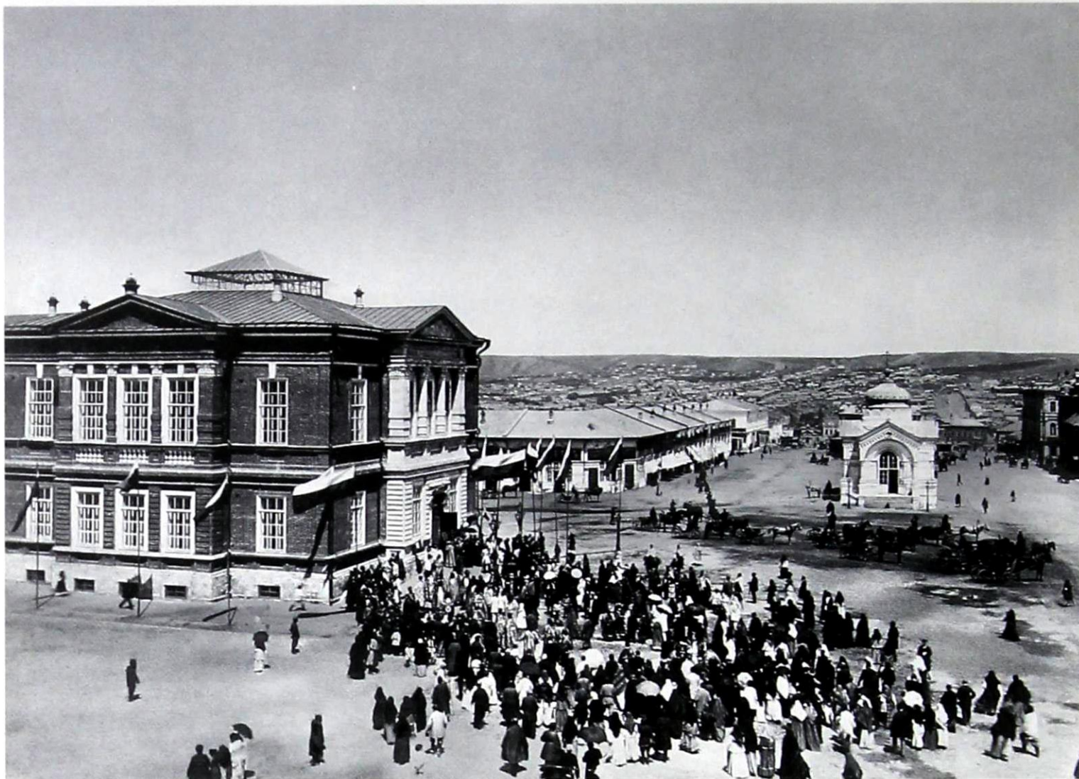
Таким был Радищевский музей в первый год своего существования. Фотография 1885 года

Дорогая семейная реликвия бережно хранилась, переходя от поколения к поколению. В книге были утрачены титульный лист, первые и последние страницы, а впоследствии вместо них вшиты уже рукописные вставки, возможно сделанные самим А. П. Боголюбовым. На титульном листе имеется надпись: „Братья Боголюбовы приносят этот экземпляр книги сочинения Александра Николаевича Радищева музею его имени в Саратове. Просят управление музея хранить его как дорогую библиографическую редкость и не выдавать для чтения.