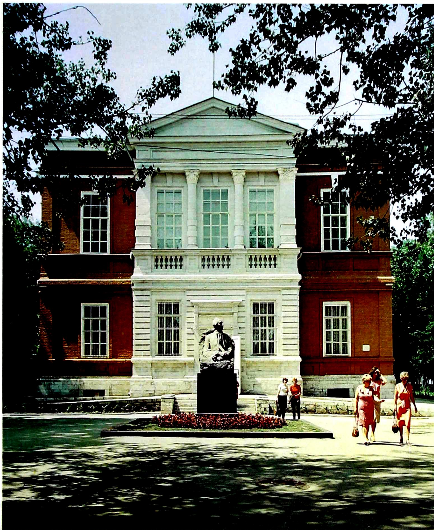
Здание Саратовского государственного художественного музея имени А. Н. Радищева