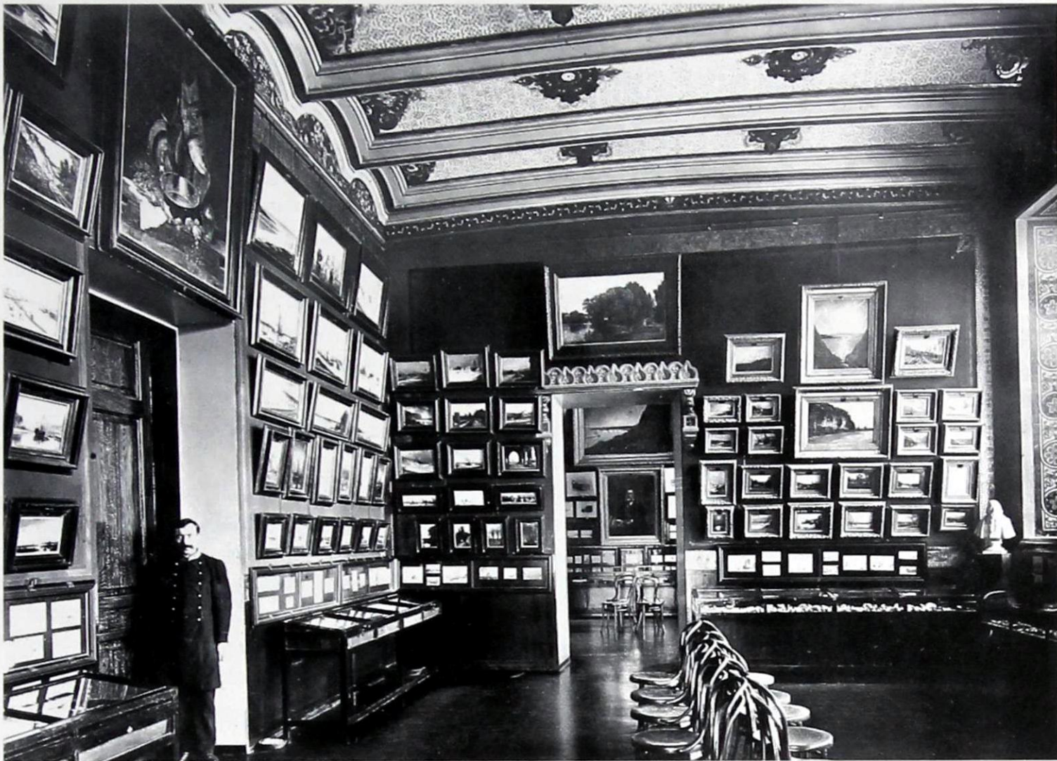
Зал А. П. Боголюбова. Фотография 1900-х годов

ния 1790 года в количестве. . . 100 экземпляров. Книга была выпущена на разных сортах дорогой бумаги. В Радищевском музее хранится один из экземпляров этого редкого издания.