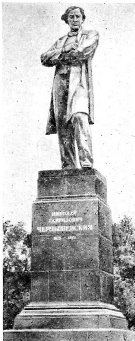
Памятник Н. Г. Чернышевскому на площади его имени.

В дни празднования 125-летней годовщины со дня рождения Н. Г. Чернышевского, 26 июля 1953 года, на площади его имени в центре города открыт монументальный памятник российскому Прометею, выполненный скульптором-саратовцем лауреатом Ленинской премии