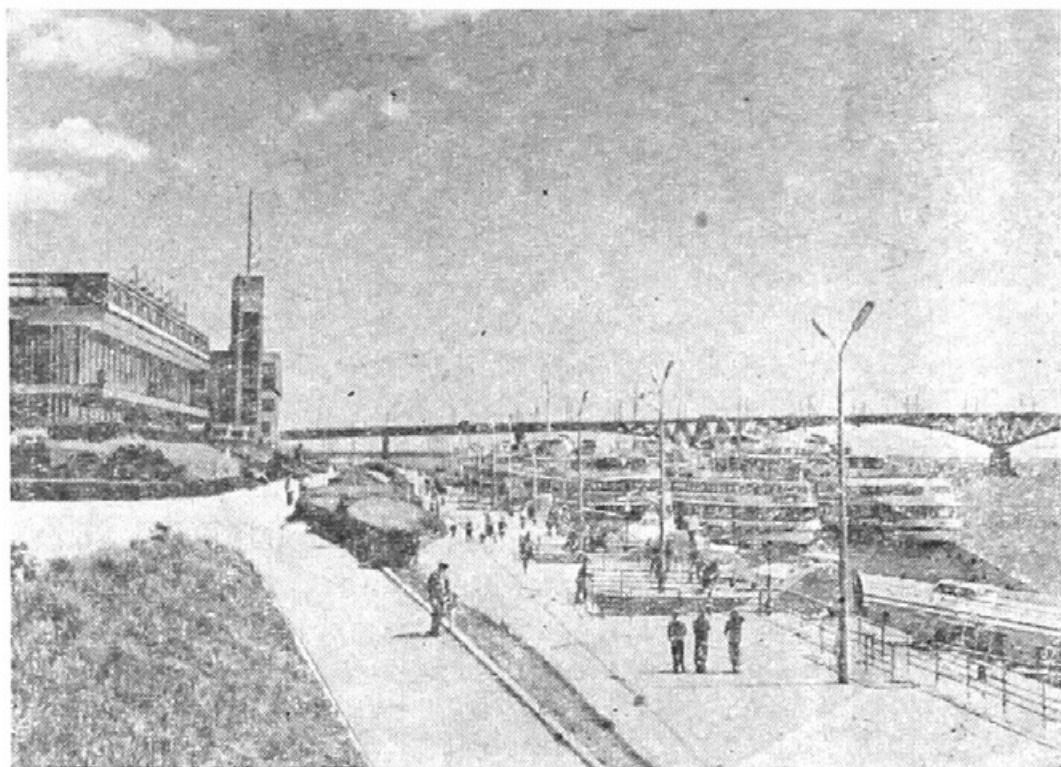
Саратов. Набережная Космонавтов.

Многие крупные исторические и политические события России связаны с Саратовом и Саратовской областью самым тесным образом. Здесь бушевало пламя крестьянских войн под руководством Степана Разина и Емельяна Пугачева. Волжский город дал миру российского Прометейя — Н. Г. Чернышевского. Саратов и область являются родиной целой плеяды выдающихся ученых и изобретателей, деятелей литературы и искусства, внесших достойный вклад в прогресс общества. В годы иностранной военной интервенции и гражданской войны саратовские полки громили белоказаков, белочехов, отбивали натиск Колчака и Деникина. Отсюда, из саратовских степей, пошла слава легендарного начдива 25-й дивизии В. И. Чапаева.