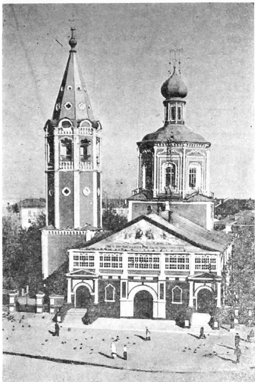
Троицкий собор в Саратове — архитектурный памятник конца XVII века.

строили крытую галерею и трапезную. Это несколько изменило первоначальный вид здания и придало ему тяжеловатость. Но и в таком виде собор своей простотой и ясностью форм, архитектурными пропорциями и тонкостью декоративного наряда представляет редкий памятник национального русского зодчества. От него веет ощущением старины. Архитектор, к сожалению, до сих пор неизвестен.