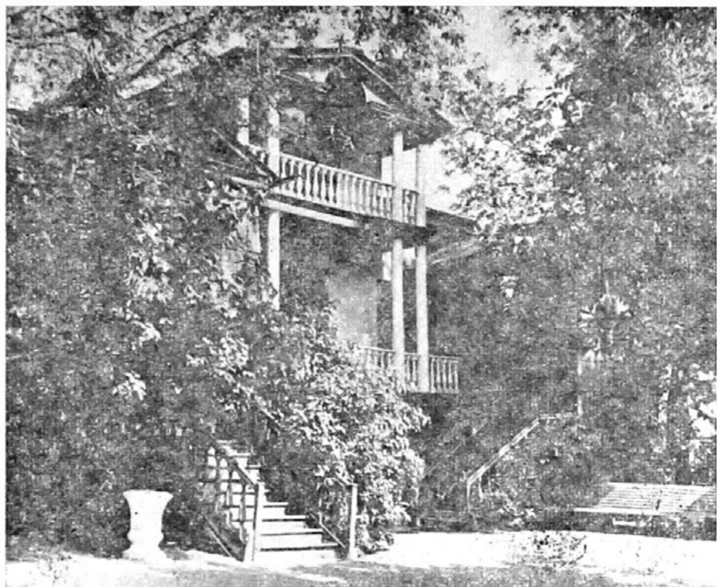
Дом-музей Н. Г. Чернышевского.