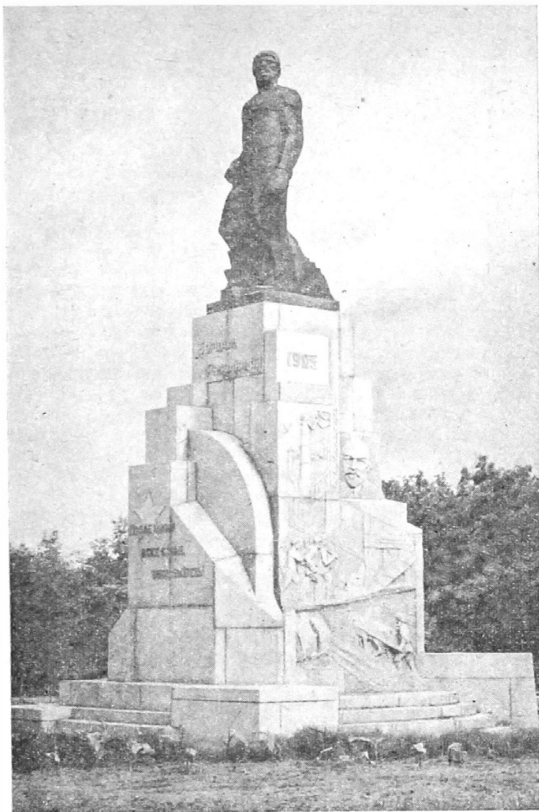
Памятник борцам революции 1905 года.