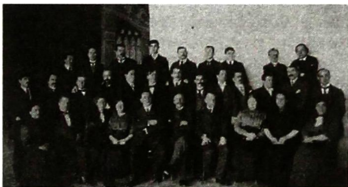
Педагоги консерватории (1912 год)