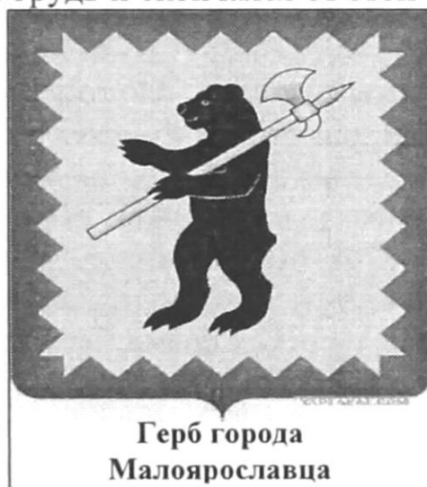
Герб города Малоярославца