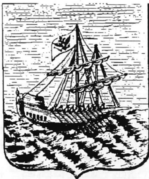
Герб города Костромы

В 1806 году, после окончания Пажеского корпуса, был выпущен корнетом в Польско-Украинский уланский полк. Правнук Ивана Бошняка Александр оставил воспоминания о своем отце: «Отец мой вступил в это заведение, походившее более на частный пансион, чем на военное училище, в тот самый год, когда из него вышел И. Ф. Паскевич (будущий фельдмаршал, князь Варшавский). Главнейшим делом и обязанностью пажей было прислуживать во дворце императорской