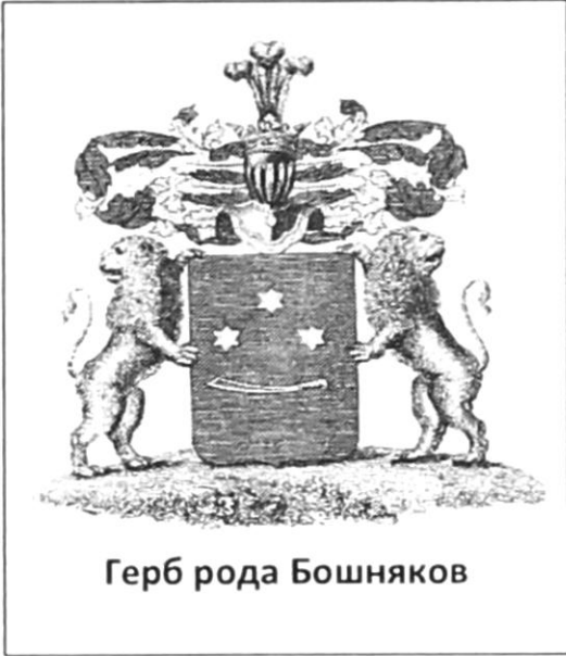
Герб рода Бошняков

В щите, имеющем голубое поле, изображены три золотые шестиугольные звезды, одна вверху и две внизу, и под оными горизонтально положена серебряная шпага, остриём в правую сторону обращённая. Щит увенчан дворянским шлемом и короною со страусовыми перьями. Намёт на щите голубой, подложенный золотом. Щит держат два льва.