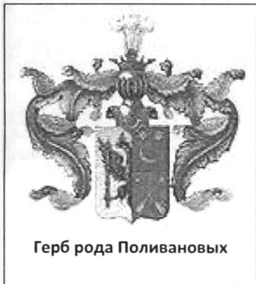
Герб рода Поливановых

Щит разделён перпендикулярно на две части, из коих в правой в серебряном поле виден выходящий с левой стороны до половины чёрный Орёл в Короне с распростёртым крылом, имеющий в лапе Скипетр. В левой части, разрезанной горизонтально чертой, в верхнем голубом поле изображены две золотые шестиугольные Звезды и под ними золотая же Луна, рогами обращённая к верхнему левому углу. В нижнем красном поле означены